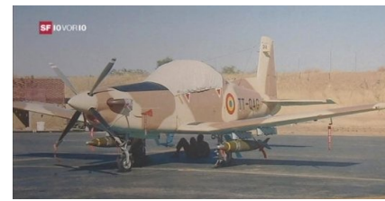
En 2008, l'armée tchadienne a fixé des bombes à sous munitions sur un avions Pilatus et bombardé des camps à la frontière soudanaise.

Rien qu'en 2008, la Suisse a exporté du matériel de guerre dans 72 pays. Il n'est pas rare qu'elle fournisse les deux parties d'un conflit, comme l'Inde et le Pakistan - deux puissances nucléaires! Particulièrement scandaleux: la Ruag fait partie des principaux producteurs mondiaux de munitions de petits calibres, qui tuent près de 1000 personnes chaque jour.